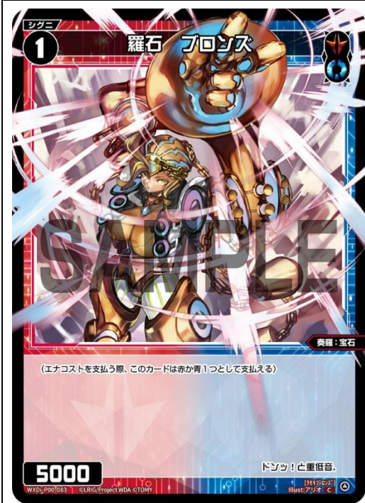
WXDi-P00-083 羅石 青銅