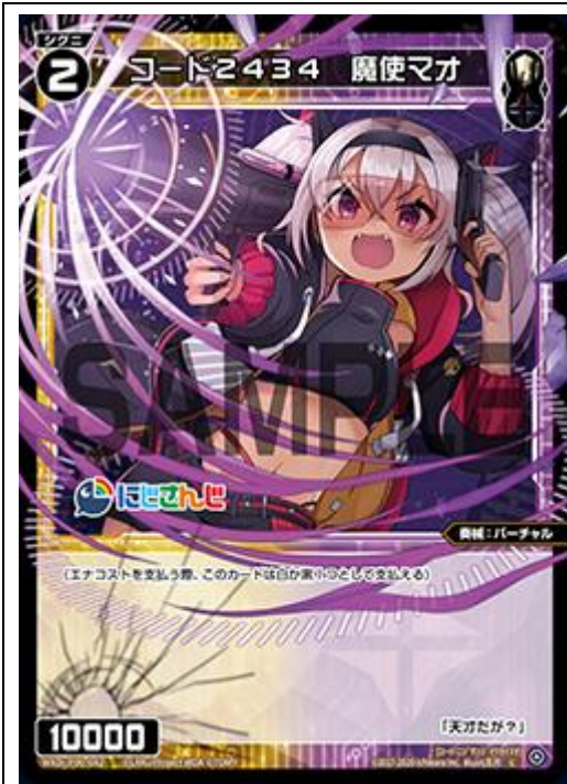
WXDi-P00-082 代號 2 4 3 4 魔使真央